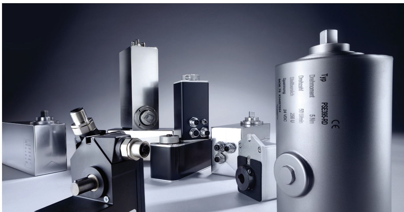
Abb. 4: Die Produktfamilie der halstrup-walcher-Positioniersysteme – optimal anpassbar auf jede Positionieraufgabe

halstrup-walcher GmbH Stegener Straße 10 79199 Kirchzarten 0 76 61 - 39 63 0 www.halstrup-walcher.de info@halstrup-walcher.de