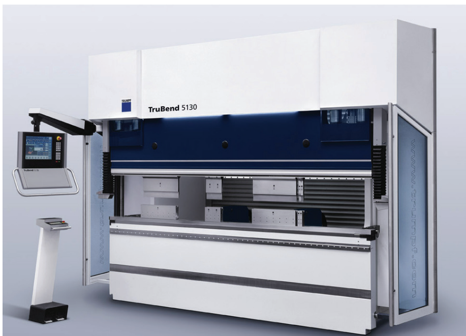
Abb. 2: Biegemaschine TruBend Serie 5000 von TRUMPF

Fortwährend werden die aktuelle Ist-Position sowie zahlreiche Über-