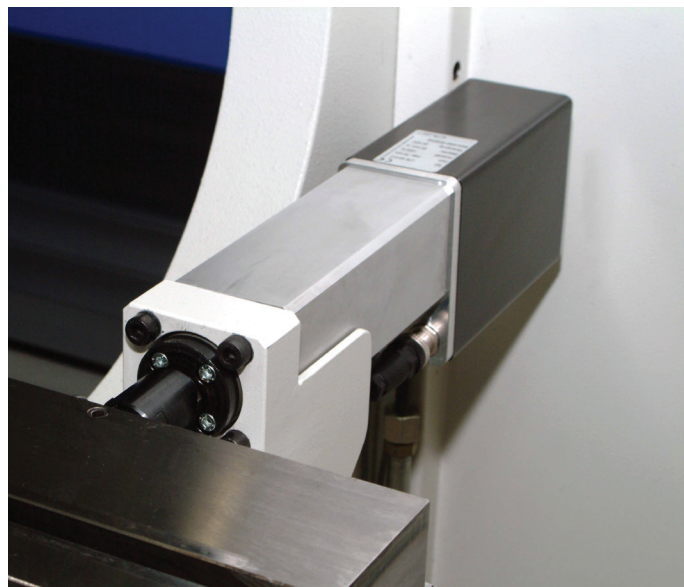
Abb. 3 a und b: Das lineare Positioniersystem LPE von halstrup-walcher. Links vorne sieht man die Matrize.

Zentraler Punkt: Alle Komponenten sind so ausgelegt, dass neben der Präzision und Effizienz immer auch die Langlebigkeit gewährleistet ist. Auf dass auch nach 10 oder 15 Jahren das Blech nicht wegfliegt, sondern auf das Verlässlichste abgekannt wird.