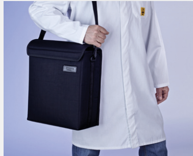
Tragetasche KAL 100 / 200 bereits im Lieferumfang enthalten