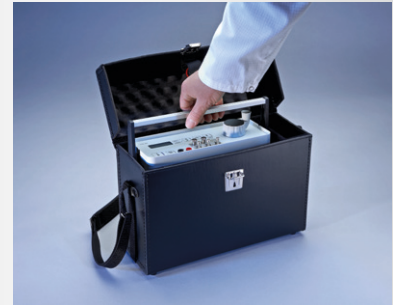
Tragetasche KAL 84 Best.-Nr. 9062.0001