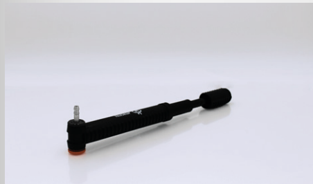
Handpumpe KAL 84 Best.-Nr. 9601.0036